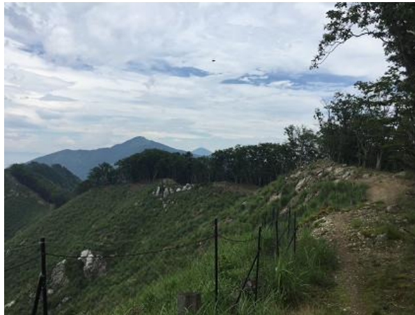
11. 展望の良い尾根道が続く