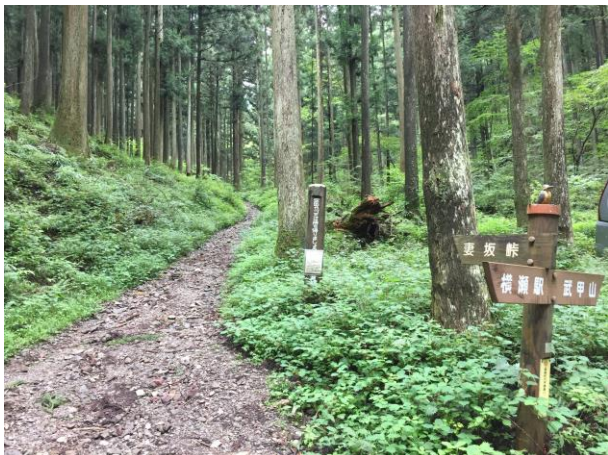
25. 道標に従い妻坂峠を目指す。