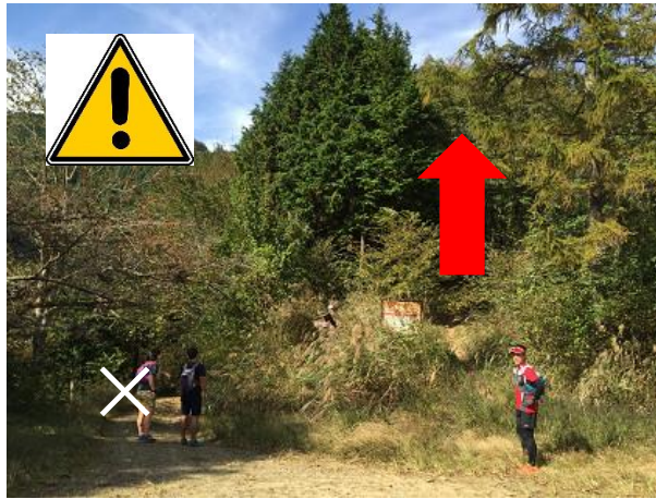
8. 逆川乗越 開けた場所に出る。まっすぐ進む。 左の林道へは 行かない。