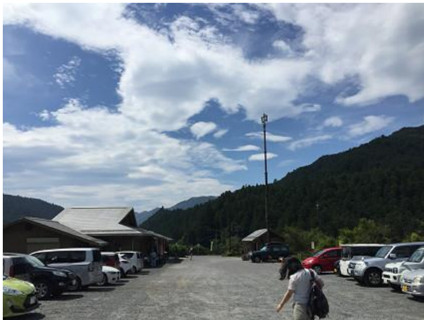
1. さわらびの湯バス停降りたところ この辺りで受付。