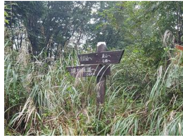
9. 逆川乗越 8番からまっすぐ少し進んだところに道標あり 次の有間山手前は急登。ファイト！！