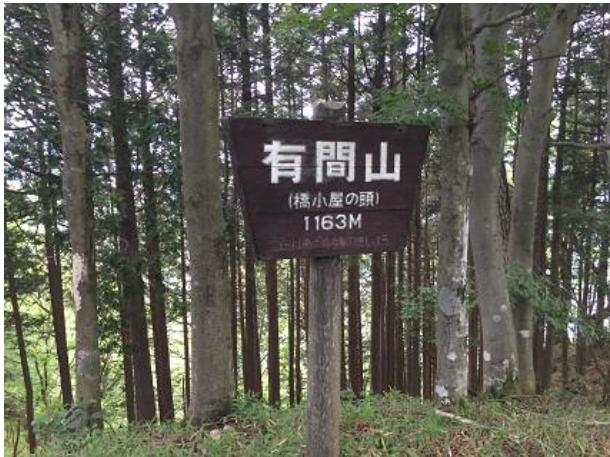
10. 有間山 (橋小屋ノ頭) ※仁田山方面へは 行かないこと