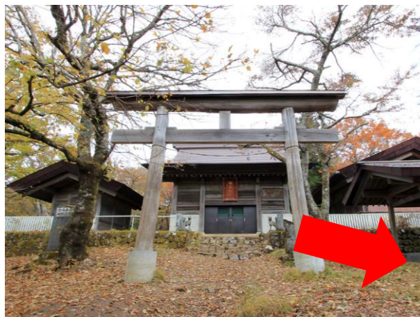
20. 武甲山 神社 展望台には行かなくても良い。 ここから一の鳥居駐車場まで約700m下り。