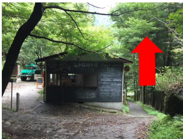
23. LOGMOGカフェ ペットボトル150円など補給可能。