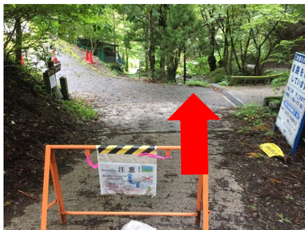
22. 分岐点 まっすぐ進む 右の道、左の道は×