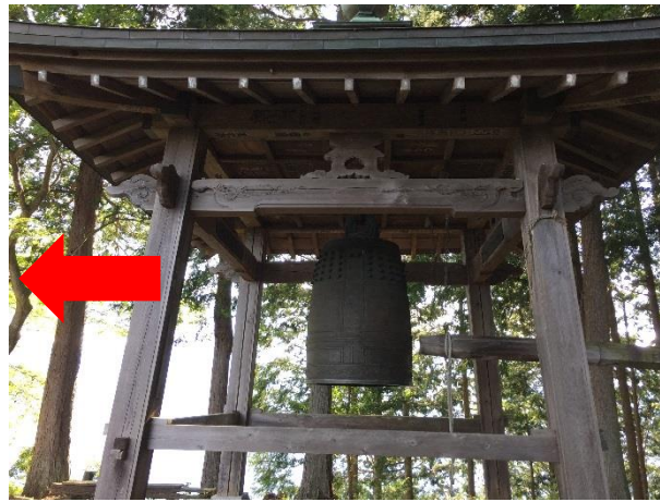
4 4. 鐘撞堂 この方向で鐘を見る状態から、左にある道から下る。小殿バス停へ。