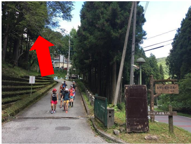
3 1. 名栗げんきプラザ エイド 。トイレあり。 入り口からロードを登った先にある本館受付 がエイド場所。エイド後は入り口まで戻り、 再びロード下りへ。