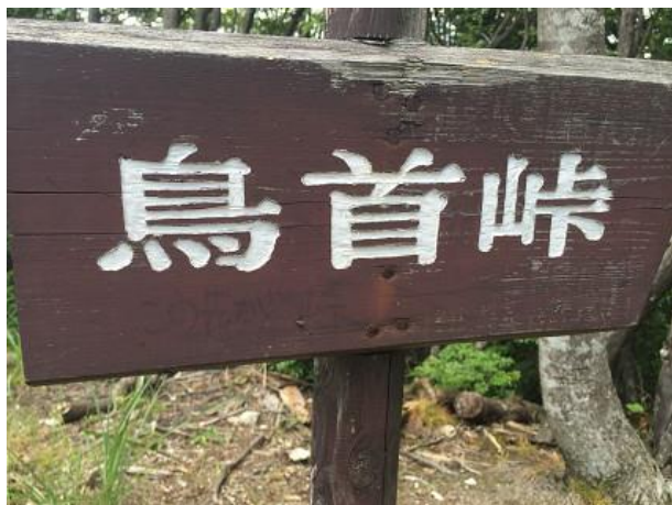
13. 鳥首峠への道標 ここで尾根沿いの道は終わり ここから激下りなので注意。