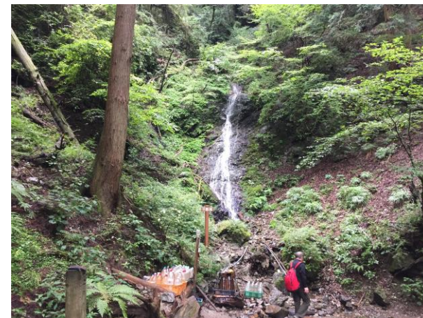
21. 不動滝 オオカミ最初の水場