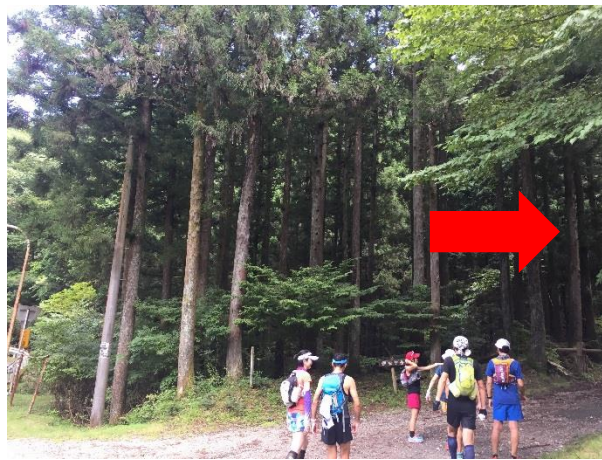
3 2. ロードを200mほど下ると分岐あり。 右折し林道へと進む。