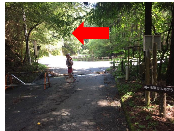
30. 林道を下るとロードに出る。 左折してロードの下り。車に注意。