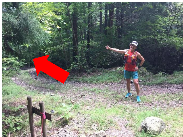
29. 下りきると林道に出る。左折。