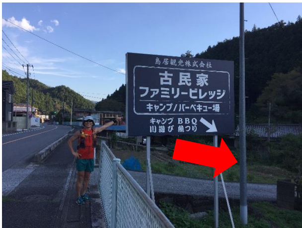
4 6. 古民家ファミリービレッジ 看板を目印に右折してフィニッシュ！