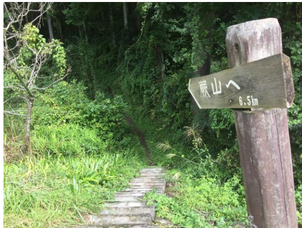
2. トレイル入口 トレイル入口はバス停と道を挟んだ反対側。 スタート地点。