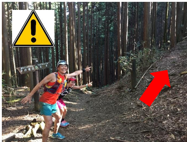
41. 豆口峠から一つ目の分岐 ここは竹寺に 行かない 。 右の道を登る。