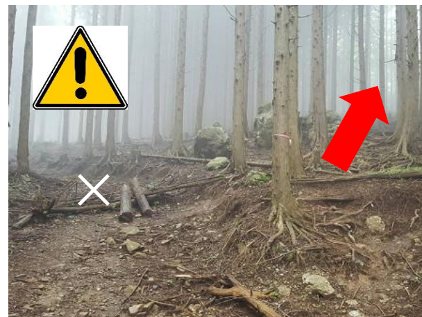
6. ここは真っ直ぐ進んで林道に入らないこと (行かせないように木を倒してある) 向かって右側のトレイルを登る