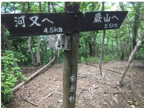
4. しばらくは道標に従い蕨山を目指す