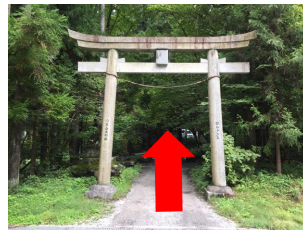
24. 一の鳥居 道標に従い妻坂峠を目指す。