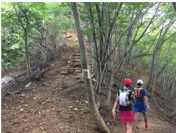
3 4. ここの分岐はどちらでもOK。 どちらでも同じところに着く。