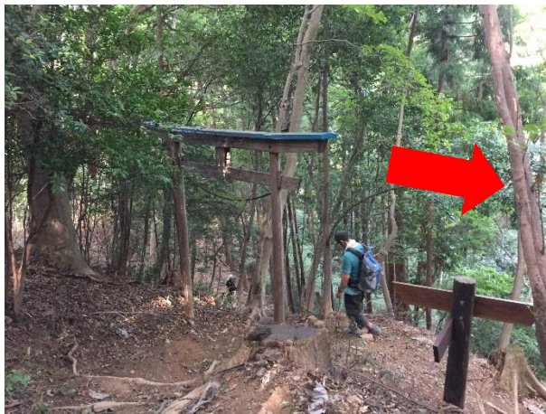
38. 子の権現分岐。鳥居あり。 コースは右折。 補給が必要な人は左折して子の権現へ。