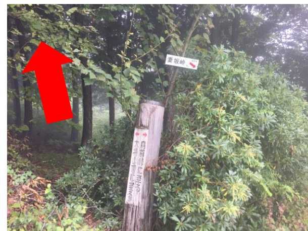
18. 大持山手前の分岐 大持山へ向かう。 妻坂峠には行かないこと