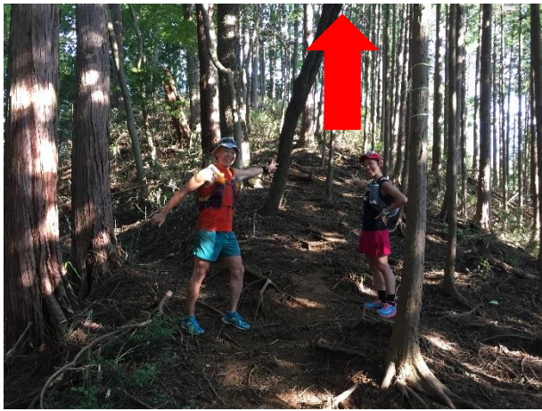
4 3. 4 1 番の分岐から500mほど進んだところ。少し分かりにくい、最後の登りで鐘撞堂へ。 左のまき道に行かないように。