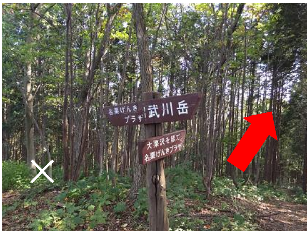
28. 分岐 「大栗沢を経て名栗げんきプラザへ」 の方に進む。