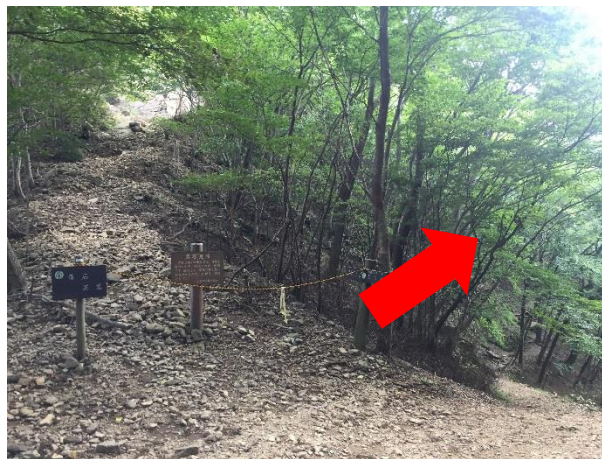
3 5. 伊豆ヶ岳への登りは女坂を進むこと。