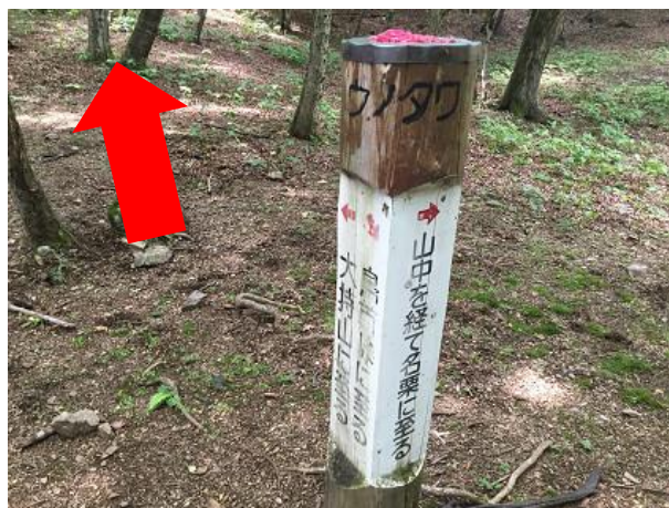
17. ウノタワ 大持山方面へ進む