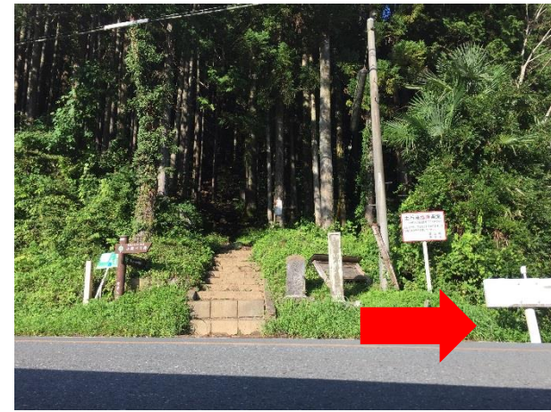
4 5. 小殿バス停 トレイル区間終わり。ここからロード区間。車に注意すること。