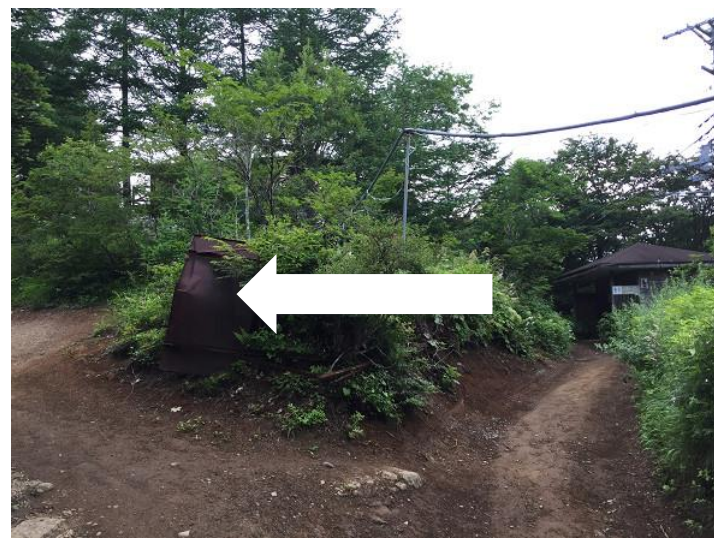
四季樂園手前。 左の道で四季樂園へ。 右の道にはトイレあり。