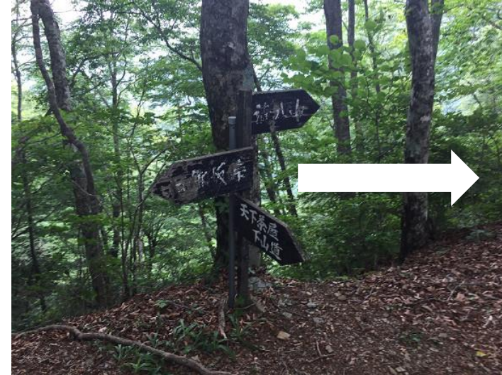
分岐。 清八山方面へ進む。 アップダウンを繰り返す。