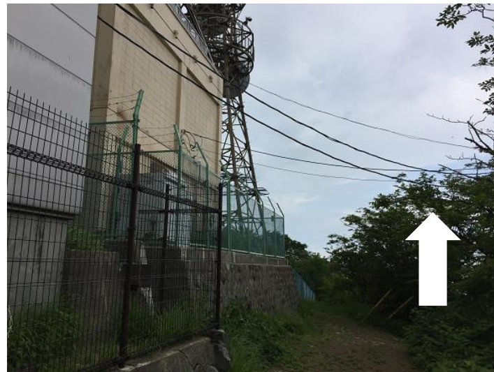
鷹ノ巣山。 道標はない。電波塔を横切る形で進む。