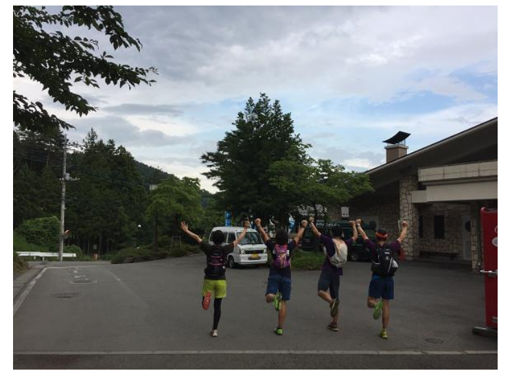
駐車場を横切り、グリーンセンター入り口で ゴール！！

四季樂園から先 カメ：三ツ峠グリーンセンターへ下山 ウサギ：もう1周して下山 オオカミ：もう2周して下山