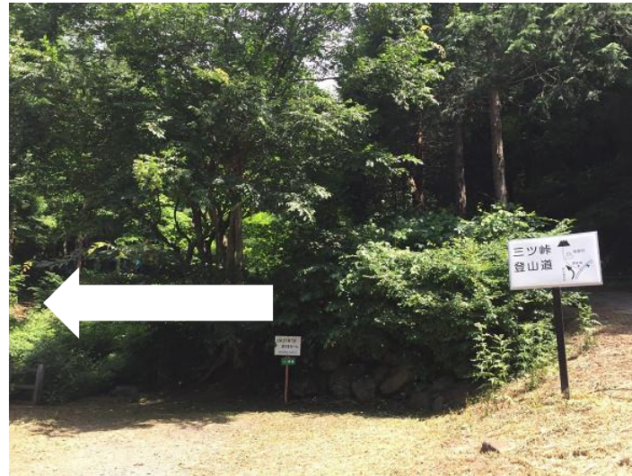
道から外れるように左折して橋を渡る。 案内あり。