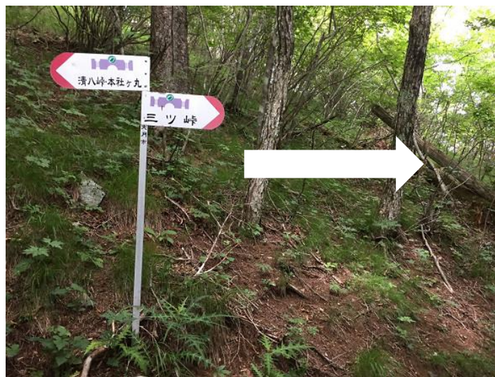
分岐。 右折して「三ツ峠」方面へ。