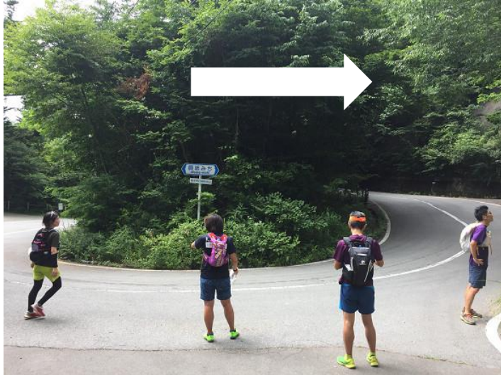
ヘアピンカーブに出る。 ここは右側へ進む。 ロード1~2km。