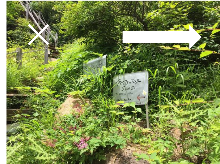
三ツ峠山荘には進まないこと