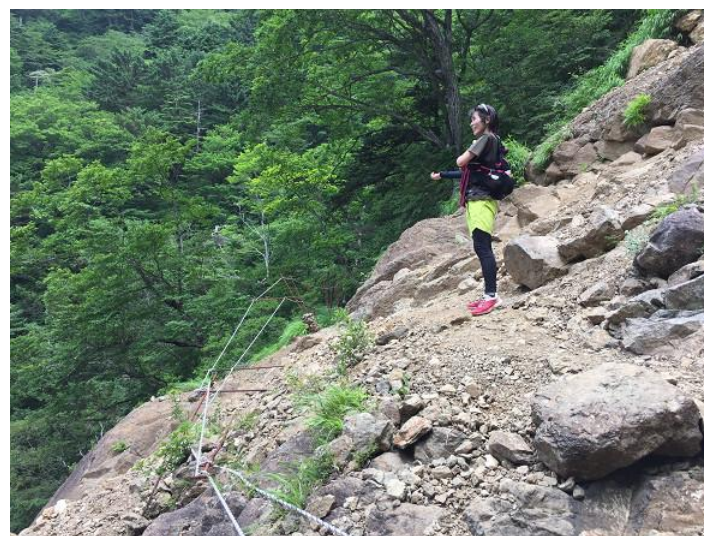
崩落箇所。 注意して進む。