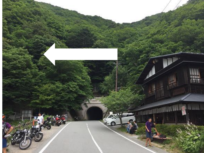
天下茶屋に到着。 トンネルには進まず、手前を左折して トレイルに入る。