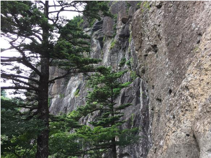
屏風（びょうぶ）岩の付近にはクライマーが多いので注意。