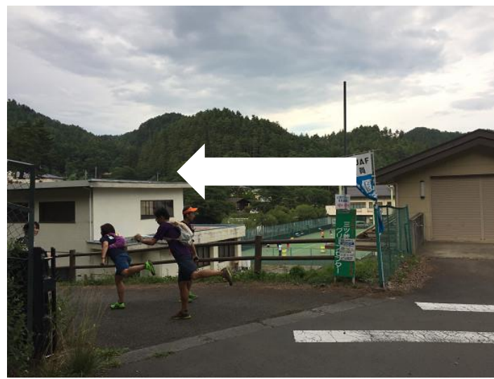
下りきったところで、三ツ峠グリーンセンターへ