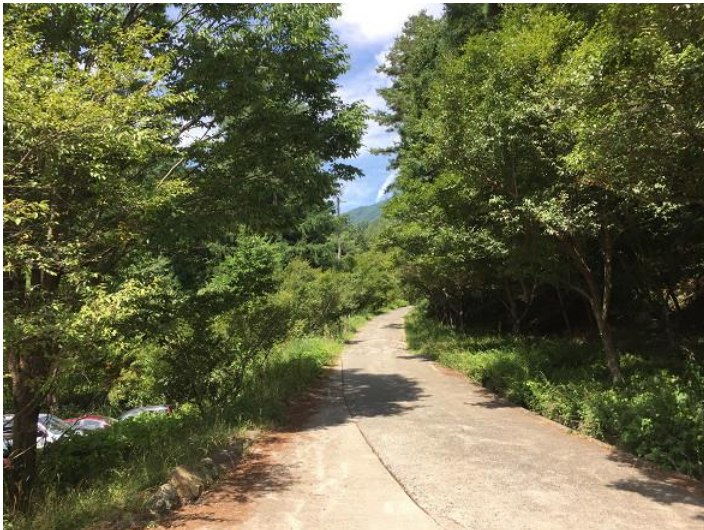
スタート地点。 しばらくはロードの登り。 ここから四季楽園まで1000mほど登り。