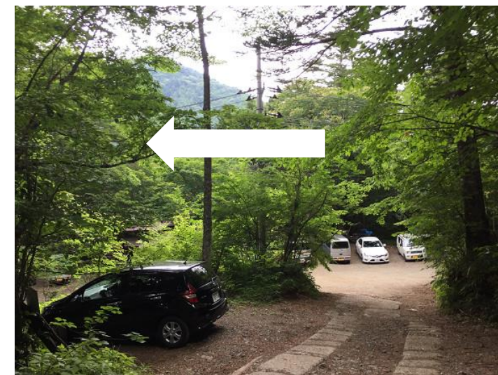
長い林道を下ると駐車場に出る。 ここは左折。トイレあり。