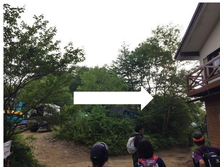
四季楽園から先、右の道へ進む。