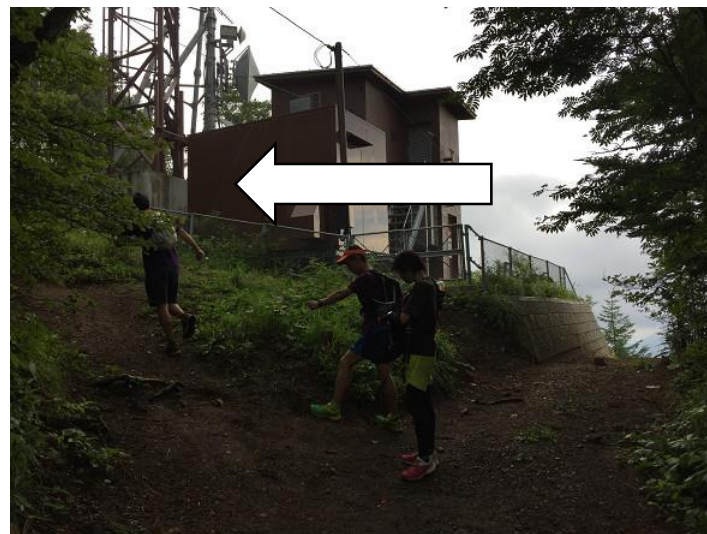
分岐。 左折して三ツ峠山（開運山）へ。