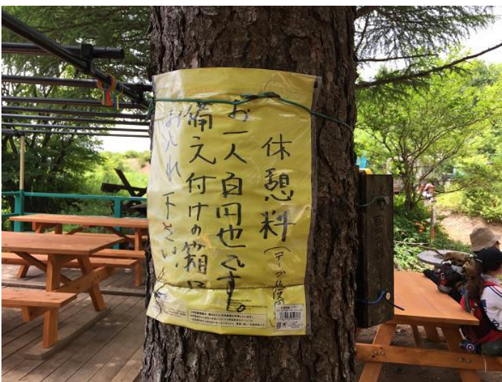
四季楽園 休憩スペース利用する場合は100円支払う。 ペットボトル自販機あり。300円。