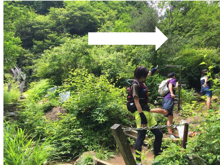
山荘手前の分岐は右へ進む。 これより道幅が狭いので通行注意。