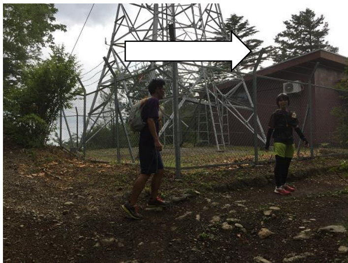
分岐。 右の道へ進む。