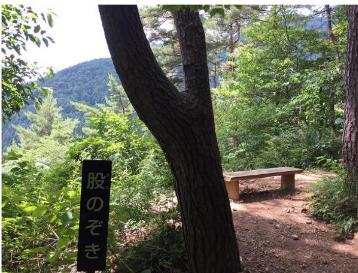
股のぞき。 幹の間から富士山が見えるかも！？