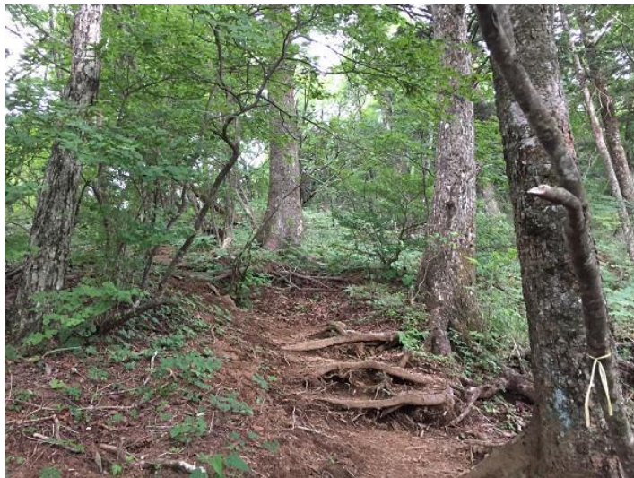
鷹ノ巣山へのキツイ登り。 300mほど登る。 ガンバレ！