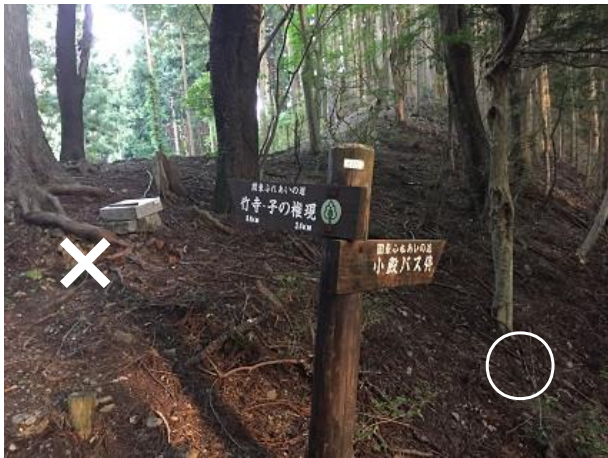
37. 分岐 小殿バス停へ降りる