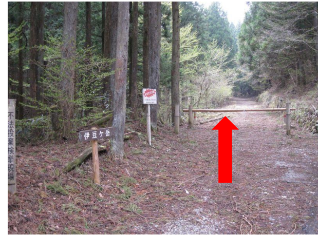
21. ロードを進んでいると、右手にトレイルの 入り口がある。伊豆ヶ岳方面へ。