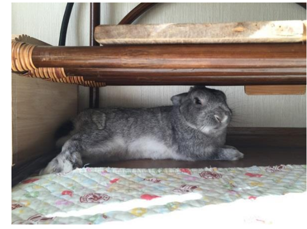
30. 一休みしてはいかが？