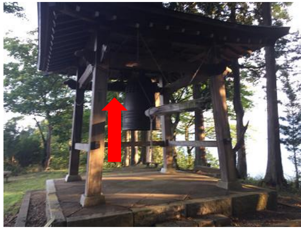
3 6. 鐘撞堂 思いのたけを込めて一撞きどうぞ！ この先登りはない。ゴールまで下るだけ！ 順路は奥の道。