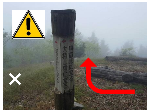
12. 大持山手前の分岐 ここから妻坂峠まで一気に下る 大持山には行かないこと