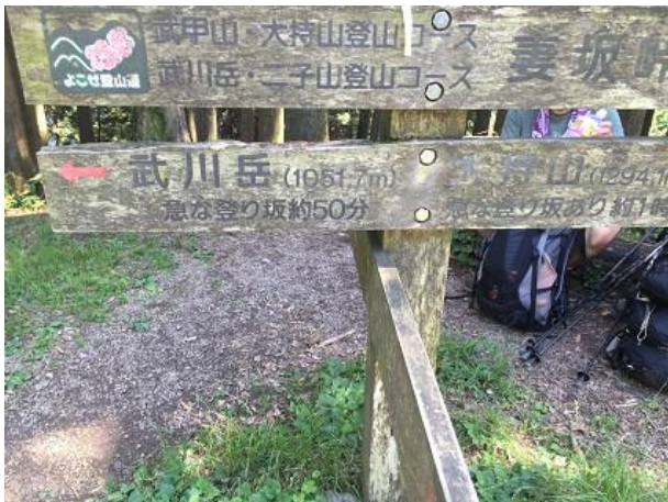
13. 妻坂峠 ここから武川岳への登り返し 急登だが、長くはない。頑張れ！！