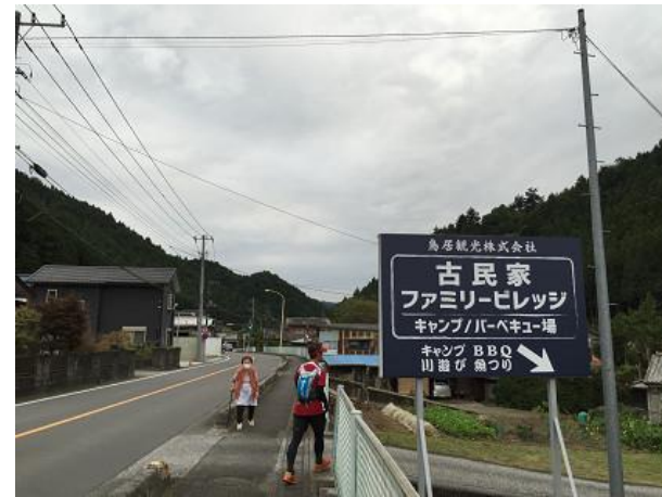
39. 古民家ファミリービレッジ 看板が目印 完走おめでとう！