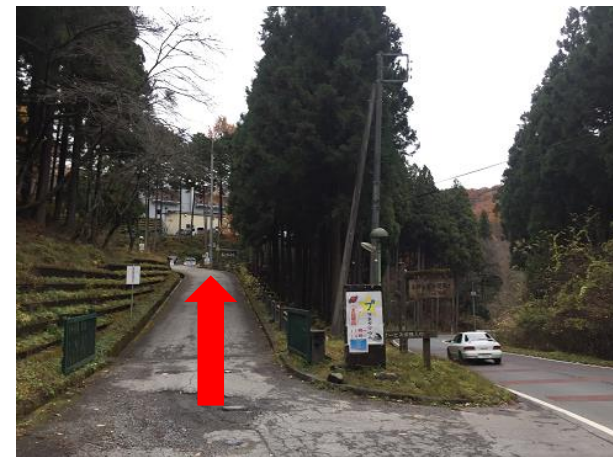
18. 名栗げんきプラ入り口 登ったところにある本館入り口がエイド場所