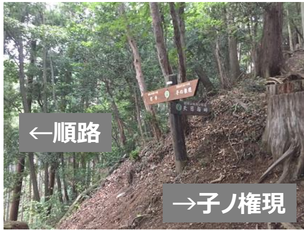
3 3. 子ノ権現分岐 補給・トイレが必要な場合、子ノ権現に寄る 走って5分くらい