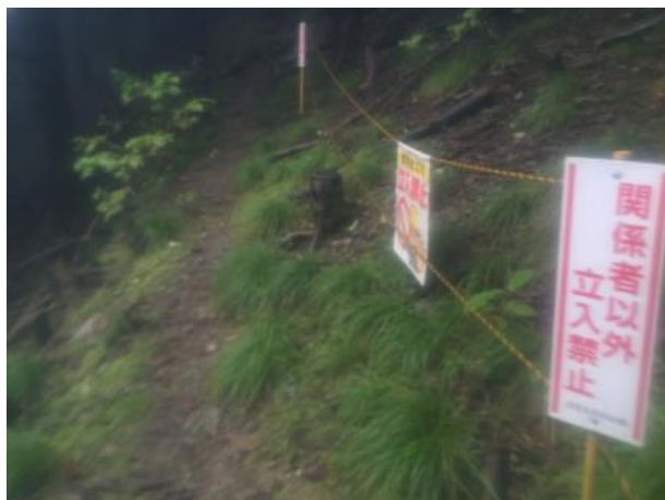
10. 立入禁止のロープを右手に見ながら進む