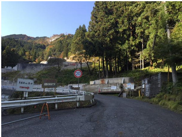
4. ここでロード区間終わり