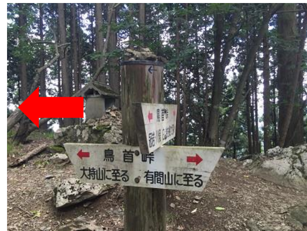
9. 大持山方面へ進む