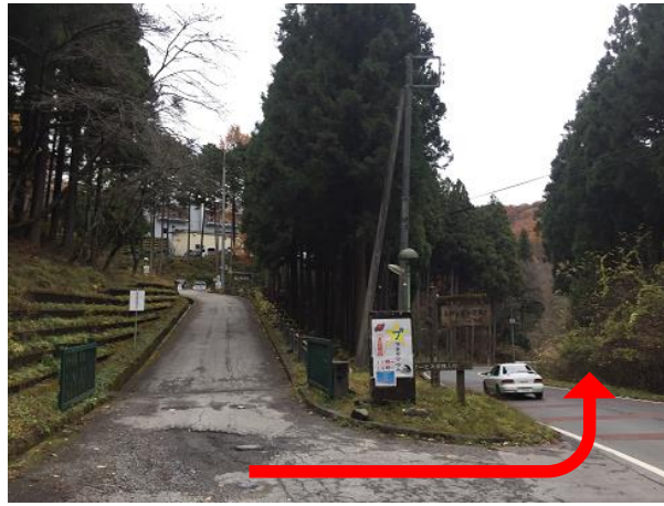
20. エイド後は名栗げんきプラザを出て、 左へ進む。300mほどロードを進む。