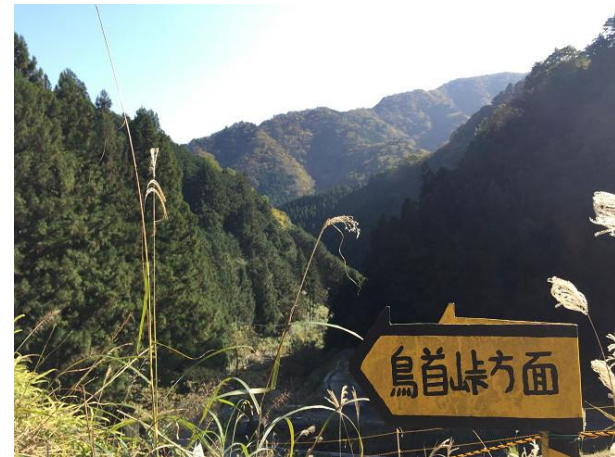
6. 鳥首峠まで登りきつけど ガンパロー！