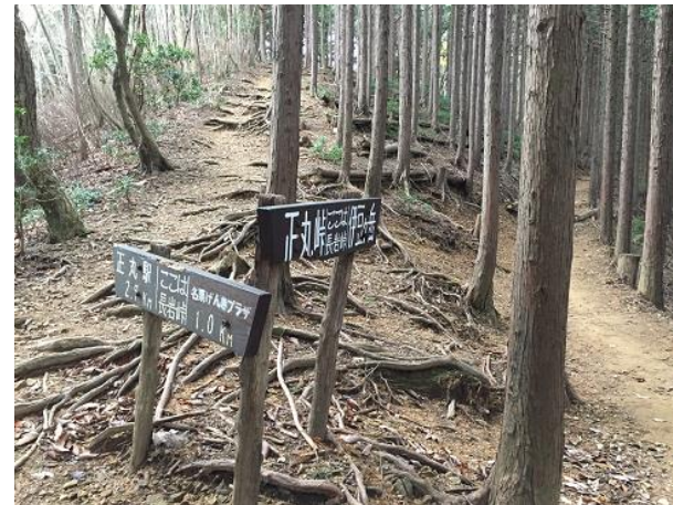
23. 長岩峠 伊豆ヶ岳方面へ進む