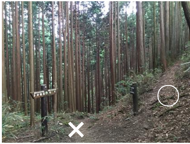
3 5. 豆口峠から進んで1つ目の分岐 竹寺（左）、鐘撞堂（右） 右の分岐へ進む 小さいピークを越える（最後の登り）