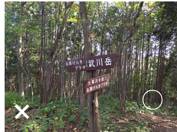
15. 分岐 「大栗沢を経て名栗げんきプラザへ」 の方に進む。