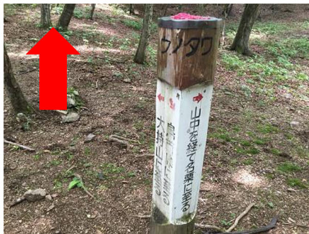
11. ウノタワ 大持山方面へ進む