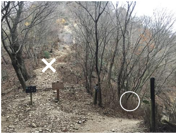
25. 伊豆ヶ岳手前の分岐 右側の女坂へ進む。女坂には途中迂回路有。 迂回路を通過すること。