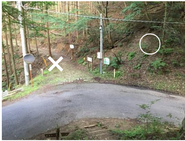
3 2. 天目指峠の先でロードを横断する。 写真の奥の林道には入らない。 向かって右奥のトレイルを登る。