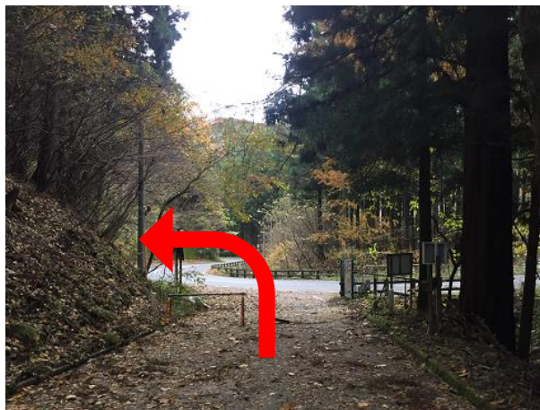
17. 林道終わり。 ロードに出たら進行方向左へ進む。