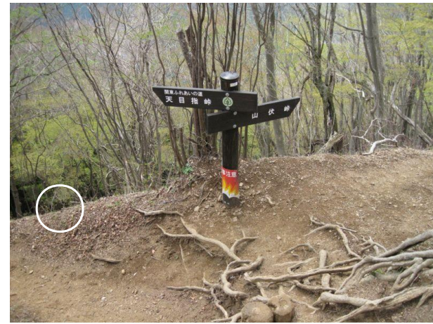
27. 伊豆ヶ岳を降りたところの分岐 天目指峠へ進む