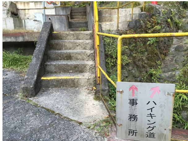
5. ここからトレイルの登りへ