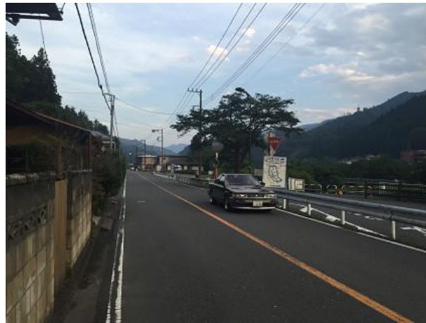
38. トレイルを出たところ 小殿バス停付近 ゴールまでロードを走る（1km程度） 焦らず、車に気をつけて！！