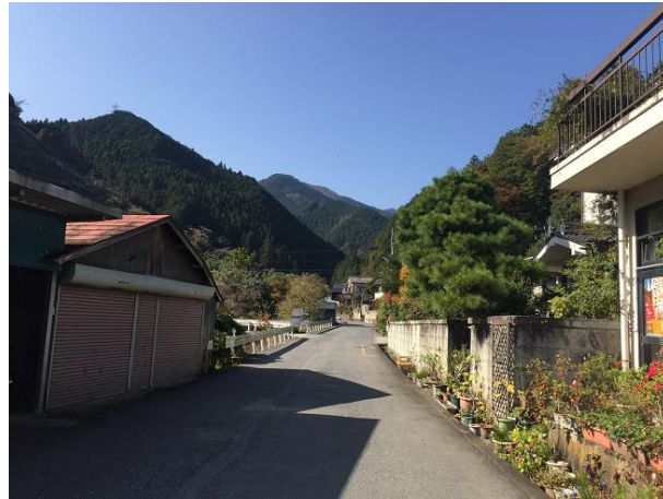
2. 売店の隣の道からスタート しばらく川沿いの道を進む