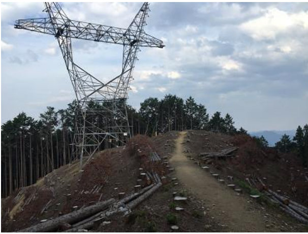
3 1. 送電線を通過する