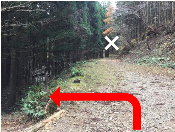
22. 入ってすぐに左への分岐があるので注意。 まっすぐ進まないこと。