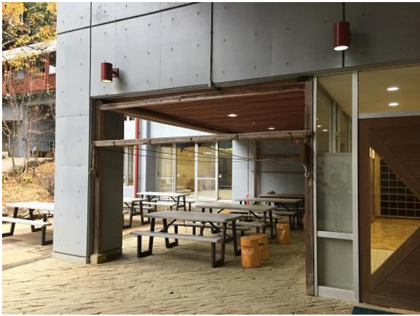
19. 名栗げんきプラザ本館入り口横が エイド場所。閉門は13時30分です。