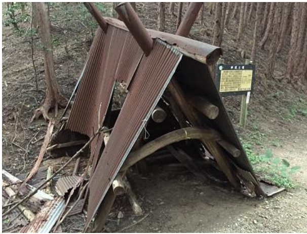
3 4. 豆口峠