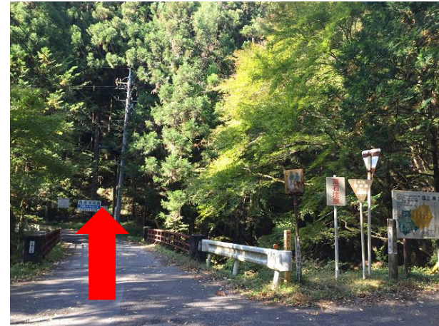
3. この分岐は橋の方へ進む (鳥首峠の道標あり)